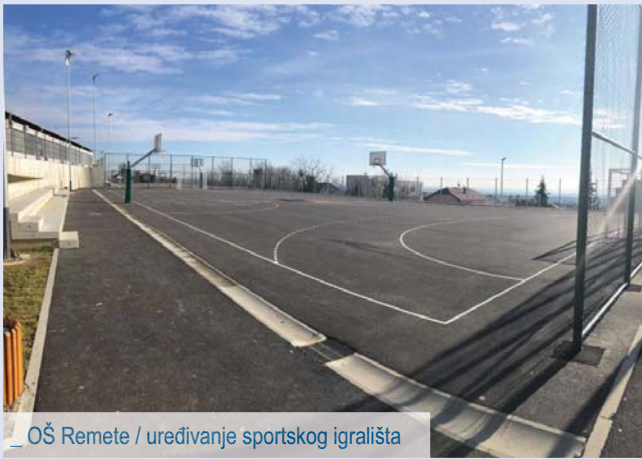
_ OŠ Remete / uređivanje sportskog igrališta