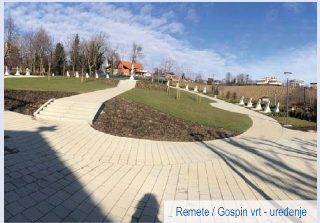
_ Remete / Gospin vrt - uređenje