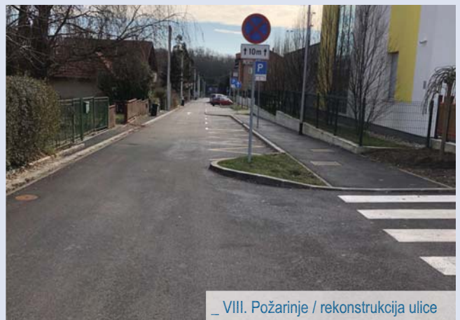
_ VIII. Požarinje / rekonstrukcija ulice