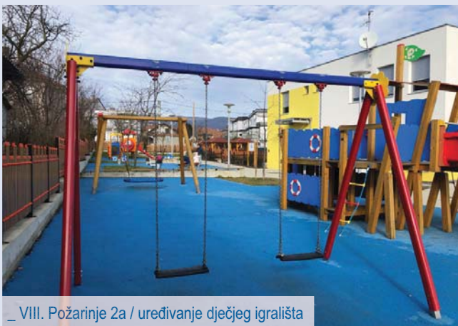
_ VIII. Požarinje 2a / uređivanje dječjeg igrališta