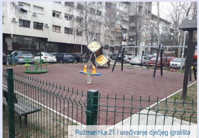
_ Ružmarinka 21 / uređivanje dječjeg igrališta