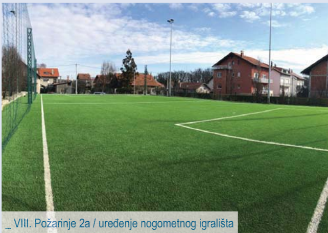
_ VIII. Požarinje 2a / uređenje nogometnog igrališta