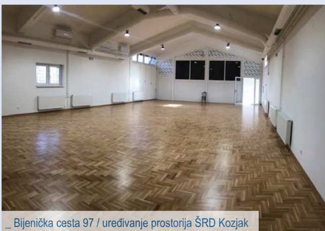
_ Bijenička cesta 97 / uređivanje prostorija ŠRD Kozjak